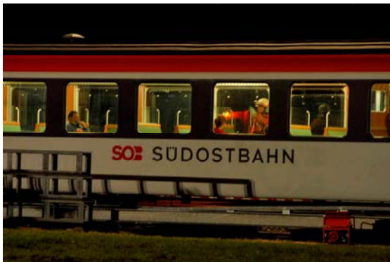
Feuerwehrleute retten im Inneren des Wagens.