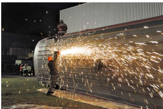
Soldaten schneiden ein Loch in das Dach des Bahnwagens um Verletzte zu bergen.