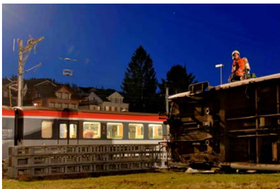
Die Rettungsarbeiten sind in vollem Gang.