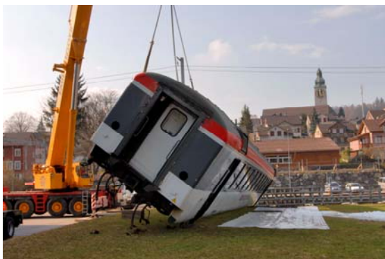
Montagnachmittag, 7. April. Der Unfallwagen – 25 Tonnen schwer – wird platziert.

Als wertvolle Erkenntnisse und Lehren aus dieser Übung nennt Max Strini drei Punkte: „Erstens: das neue Dispotool der SOB-Betriebsführung hat sich als laufendes elektronisches Journal und für die Nachbearbeitung bewährt, zweitens: die Beteiligten lernten einander kennen, was die Zusammenarbeit in einem künftigen Fall erleichtert und drittens: die Informations- und Medienarbeit bei einem solchen Ereignis ist ausserordentlich wichtig und muss sofort mit den direkt beteiligten Stäben koordiniert werden.“