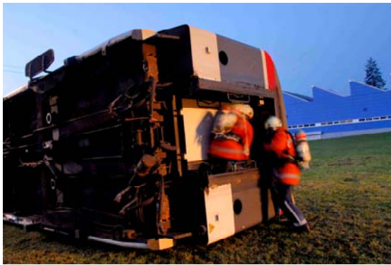
Feuerwehrleute mit Atemschutzgeräten dringen in den umgekippten Bahnwagen ein.